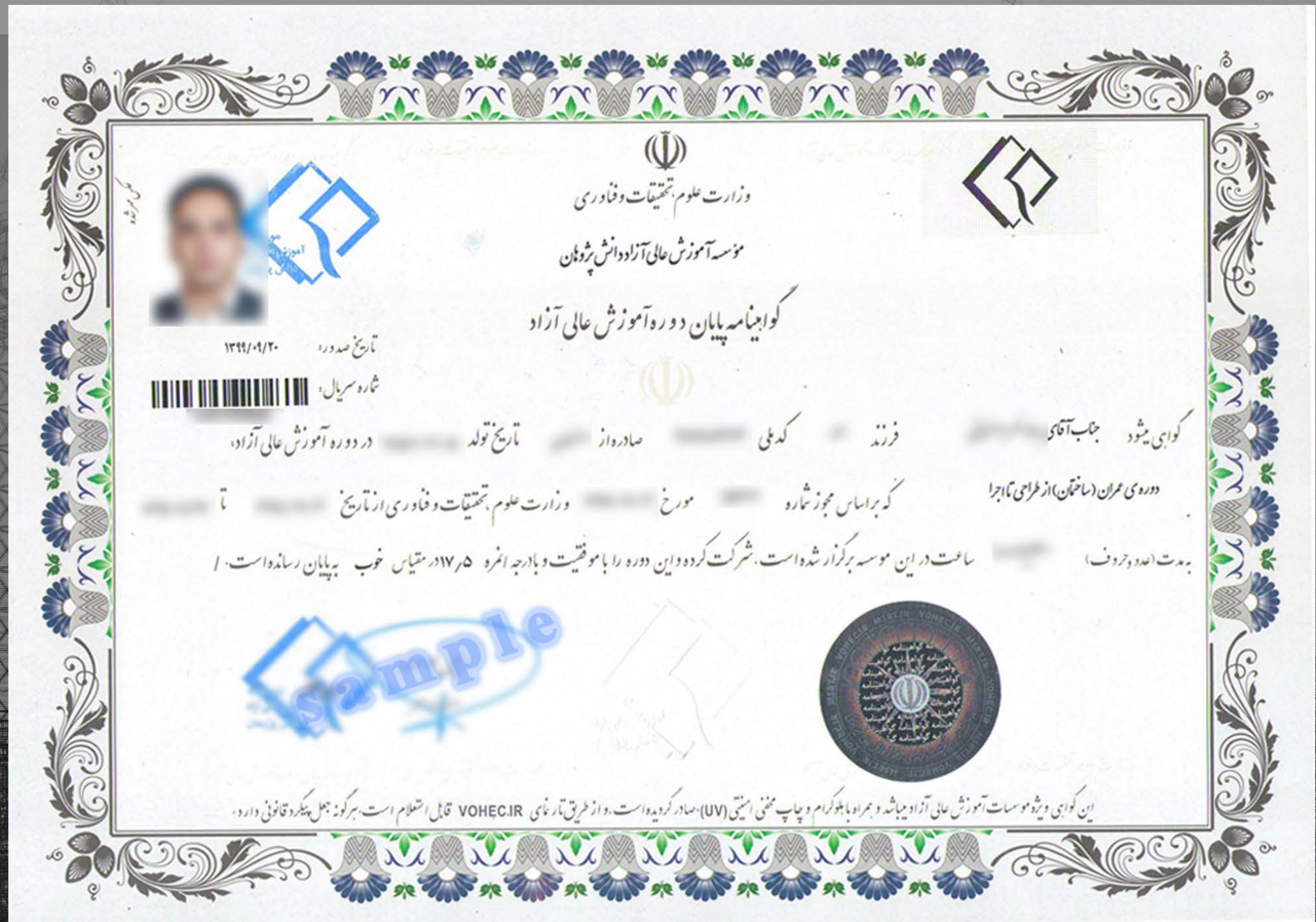
نمونه مدرک دوره اجرای ساختمان های بتنی و فولادی